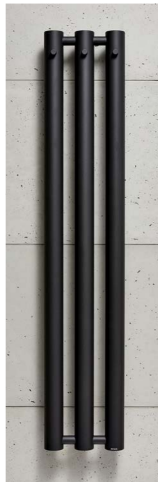
ROSENDAL R70/3B czerni