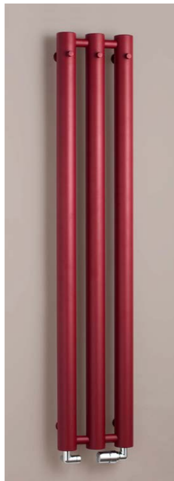
ROSENDAL R70/3RE bordo (kolor strukturalny)