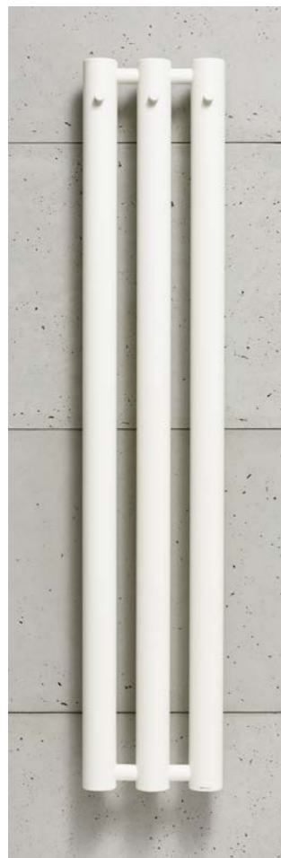
ROSENDAL R70/3W biały